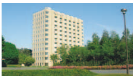
〈さいたまキャンパス〉

〒362-0806 埼玉県北足立郡伊奈町小室10281 TEL 048-721-6159 FAX 048-721-6489