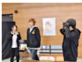
学園祭実行委員会