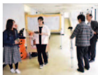
献血ボランティア