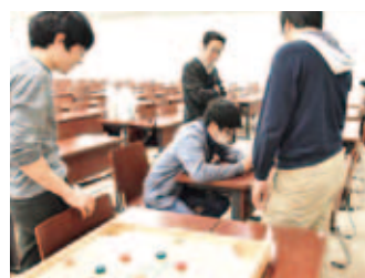
ボードゲーム同好会