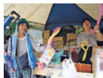
イベント・ボランティア部