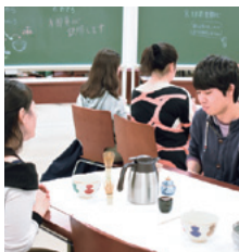
裏千家茶道部 お茶淹れ体験