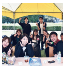
学園祭実行委員会