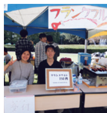
ボルダリング同好会