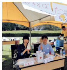
献血ボランティア同好会