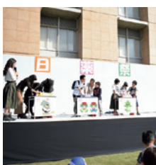
埼玉クイズ王決定戦