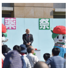
埼玉クイズ王決定戦開会式