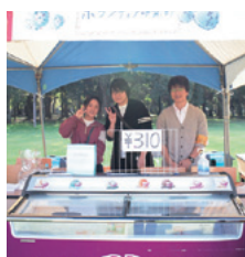
ボランティア研究部