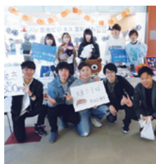
NPU会計研究会、 ファーマシューティカル ビジネス研究会