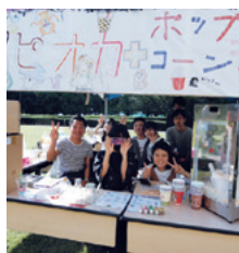
イベント・ボランティア部