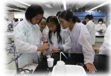
子ども大学 あげお・いな・桶川 (日本薬科大学)