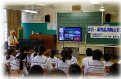
薬物乱用防止教室 (旧小鹿野町立三田川中学校)