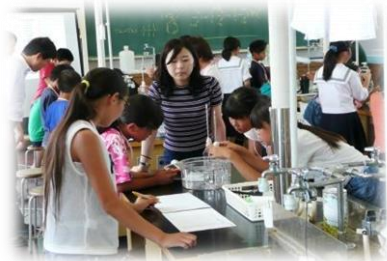
秩父サイエンスアカデミー (県立秩父高校)