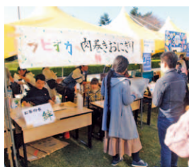
イベント・ボランティア部“絆”