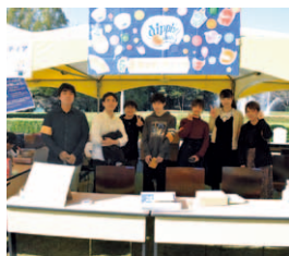
ボランティア研究部