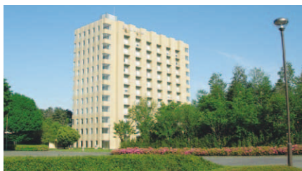
〈さいたまキャンパス〉

〒362-0806 埼玉県北足立郡伊奈町小室10281 TEL 048-721-6159 FAX 048-721-6489