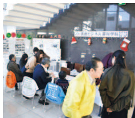
NPU会計研究会、 ファーマシューティカル ビジネス研究会