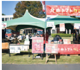
北本市・ひーこら