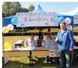
献血ボランティア同好会