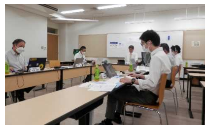
役員会・代議員会（オンライン）の実施状況