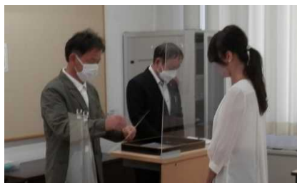
会長による委嘱状交付、会計監査

令和3年度決算報告・監査報告、令和4年度事業計画・収支（案）等について審議が行われ、全ての議題が承認されました。