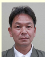
日本薬科大学後援会 会長