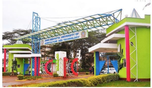
ジョモ・ケニヤッタ農工大学・正門

2023年8月25日、本学とケニア・ナイロビのジョモ・ケニヤッタ農工大学との間で、教育及び学術交流に関する友好交流協定を締結しました。本学として、はじめての、アフリカの大学との協定となります。本協定により、教員および学生の交流プログラムを通じて、研究や教育の活性化を進めてまいります。