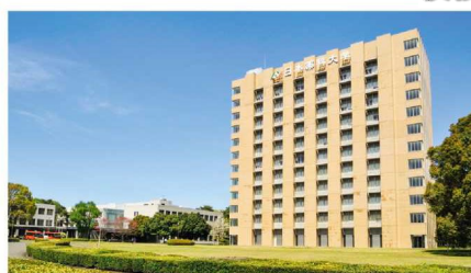
<ざいたまキャンパス>

〒362-0806 埼玉県北足立郡伊奈町小室10281 TEL 048-721-6785 FAX 048-721-6785