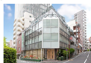
<お茶の水キャンパス>

〒362-0806 埼玉県北足立郡伊奈町小室10281 TEL 048-721-6785 FAX 048-721-6785